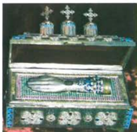
Ἡ λειψανοθήκη τοῦ Ἁγίου Γεωργίου.