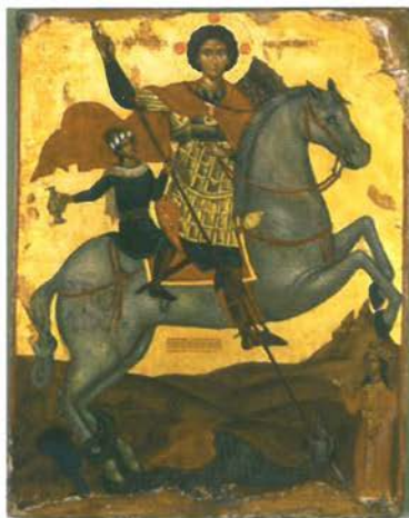
ἽΗ εἰκόνα τοῦ Ἁγίου χωρὶς τό ἀργυρὸ κάλυμμα. Διαστάσεις 116 X 87 εκ.