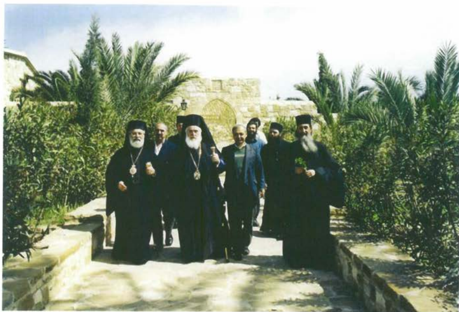
Ἐπίσκεψη τοῦ μακαριστοῦ Ἀρχιεπισκόπου Κύπρου κ. Χρυσόστομου.