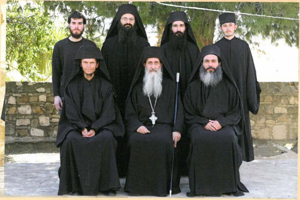
Ἡ σημερινή ἀδελφότητα τῆς Μονῆς.