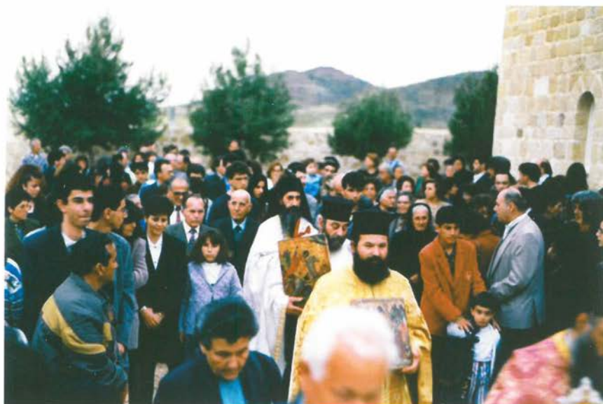
Πρώτη μέρα στό Μοναστήρι. Πάσχα 1996. 'Ο 'Εσπερινός τῆς 'Αγάπης.