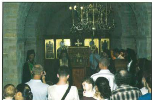
Ἐπόγειο παρεκκλήσι τῶν Ἁγίων Πατέρων τῆς Ὀπτινα.