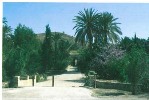
Ἡ πύλη τῆς Μονῆς.