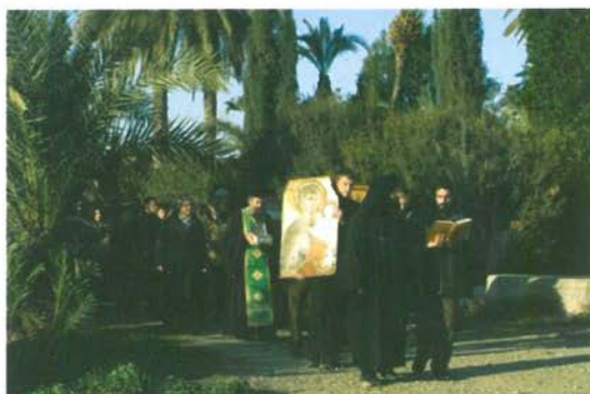
Λιτανεία γιὰ τὴν ἀνομβρία.