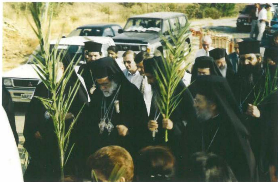
Ἐπίσκεψη τοῦ μακαριστοῦ Πατριάρχου Ἀλεξανδρείας κ. Πέτρου, προσωπικοῦ φίλου τοῦ Γέροντα τῆς Μονῆς. 27. 5. 1999.