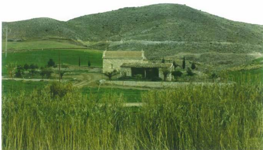
Ἡ Μονή πρὶν τὴν ἀναστήλωση.