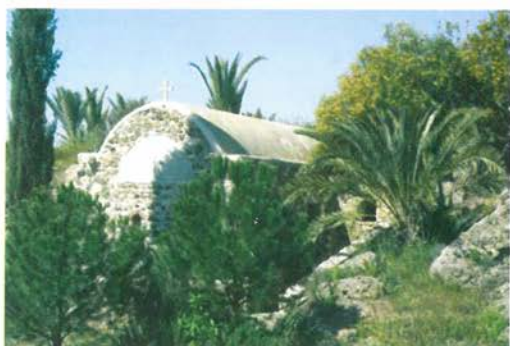
Παρεκκλήσι τοῦ Ἁγίου Νεομάρτυρος Γεωργίου τοῦ Κυπρίου καί Ἁγίας Μαρίνας.