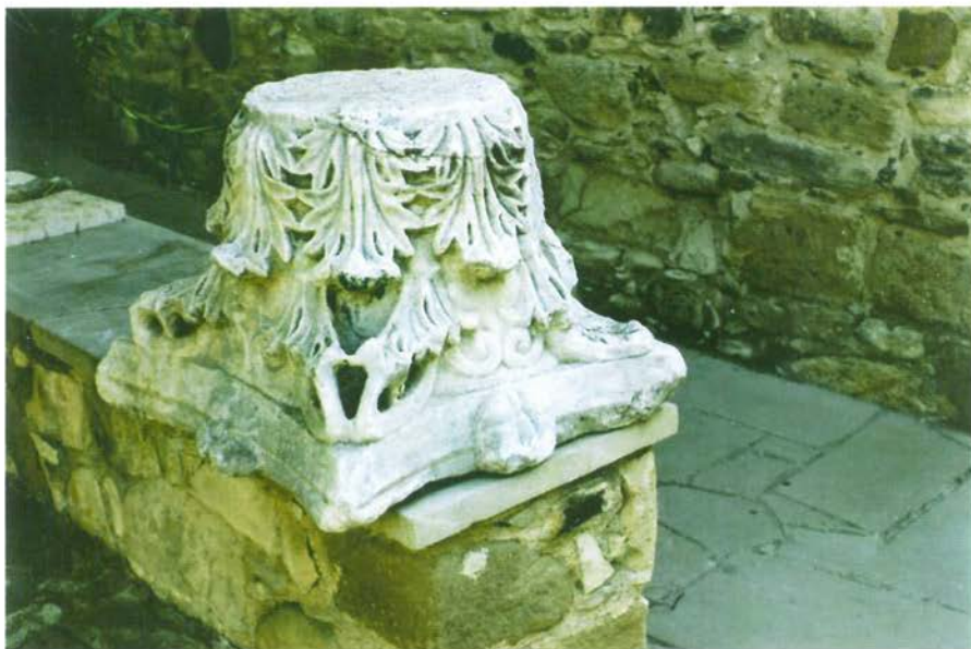
Κιονόκρανο ἀπὸ τὸ ναὸ τῶν μεταβυζαντινῶν χρόνων.