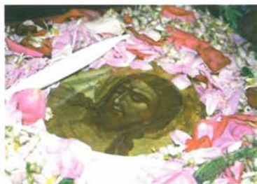
ἽΟ Ἐπιτάφιος τῆς Μονῆς.