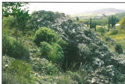
Σπηλιά Ὁσίας Μαρίας τῆς Αἰγυπτίας.