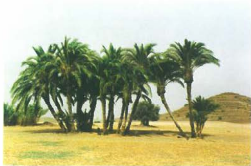
Ἡ συστάδα μέ τέσ παλιές φοινικιές.