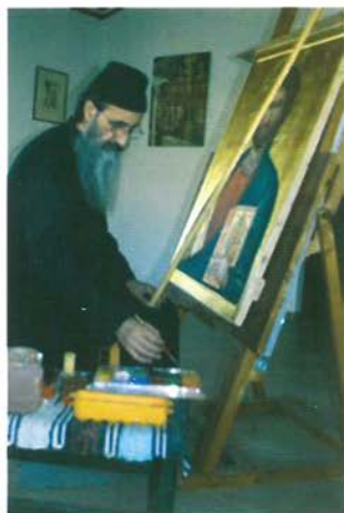
ἽΟ Γέροντας ἀγιογραφεῖ.