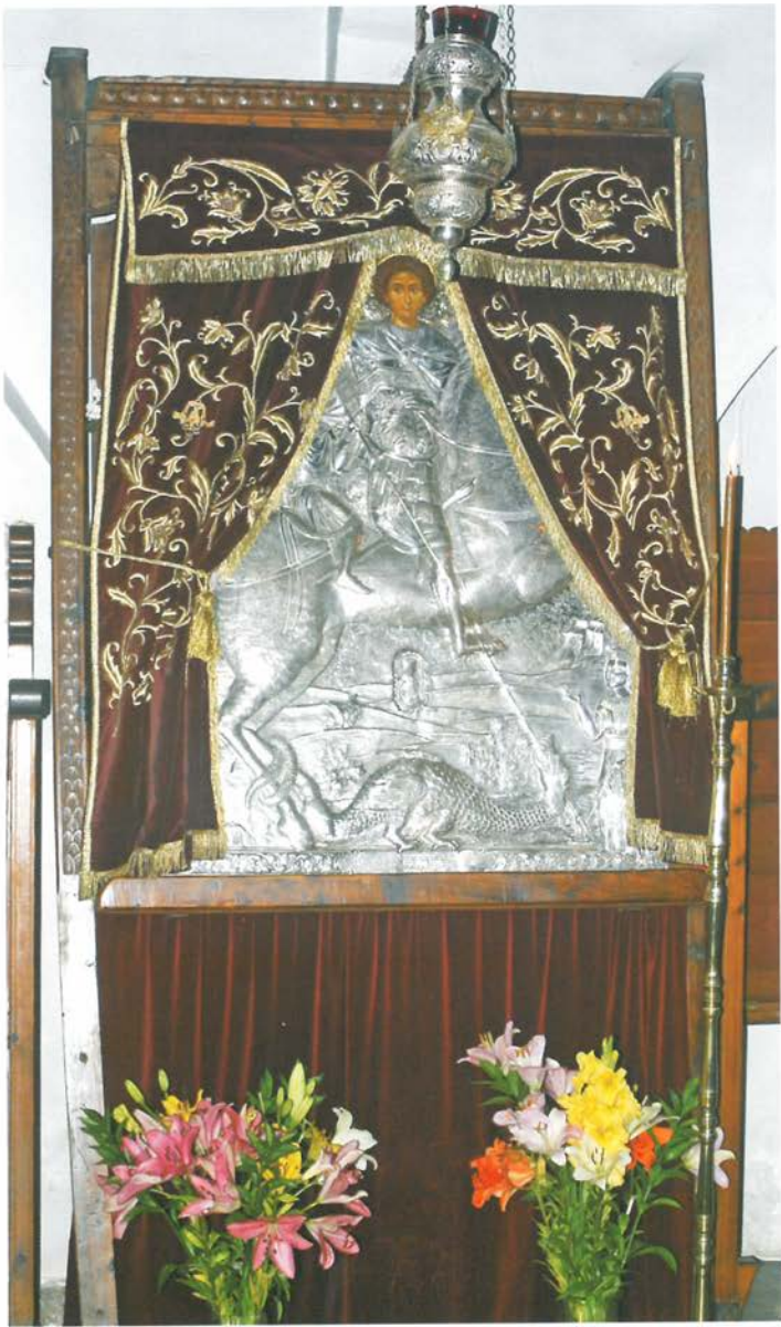
Ἡ εἰκόνα τοῦ Ἁγίου